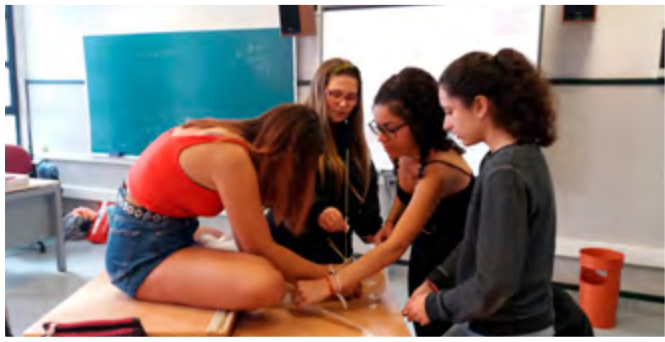
Alumnas del IES Luis Briñas.