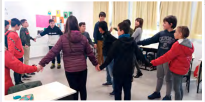
Alumnado de San Viator Ikastetxea.