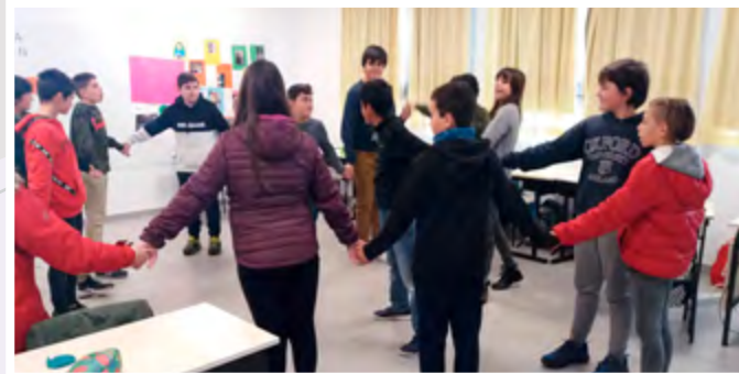
San Viator Ikastetxeko ikasleak.